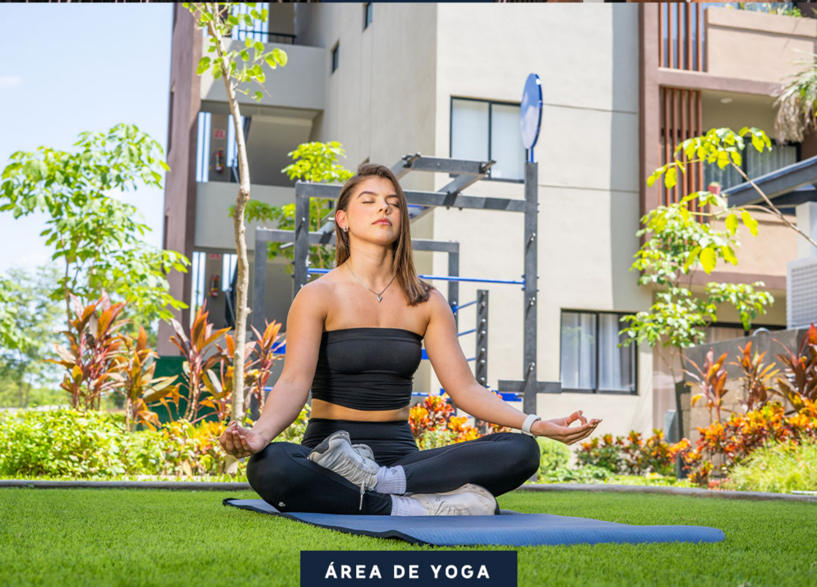
ÁREA DE YOGA