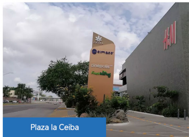
Plaza la Ceiba