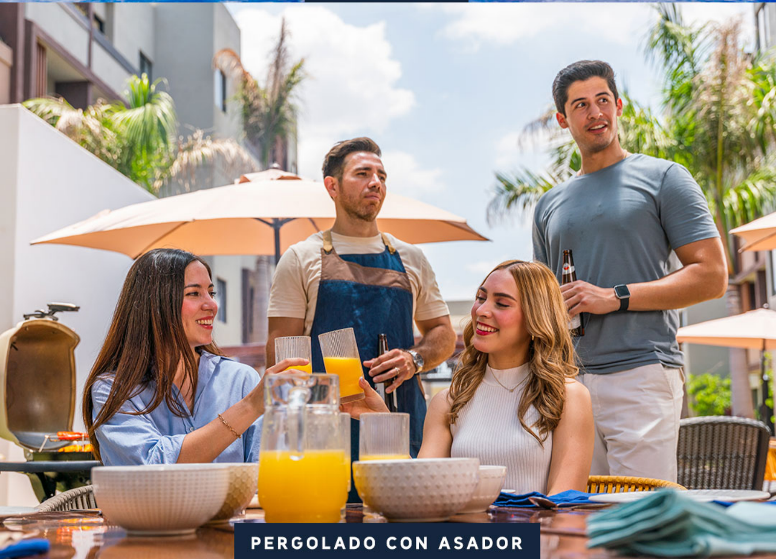
PERGOLADO CON ASADOR