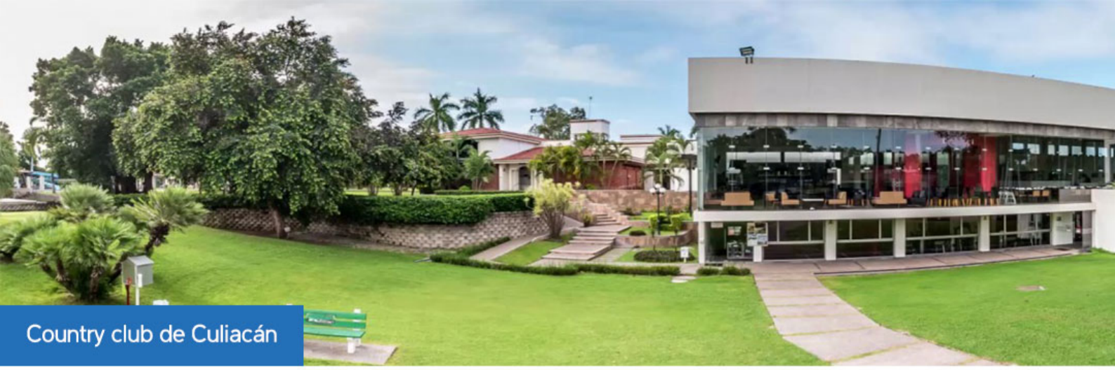
Country club de Culiacán