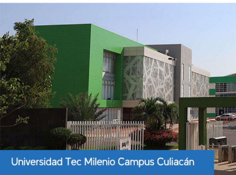
Universidad Tec Milenio Campus Culiacán