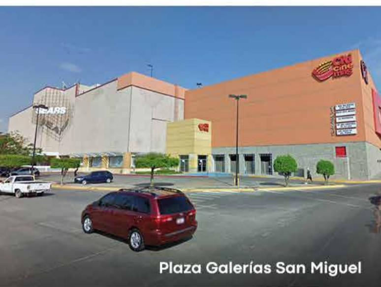
Plaza Galerías San Miguel