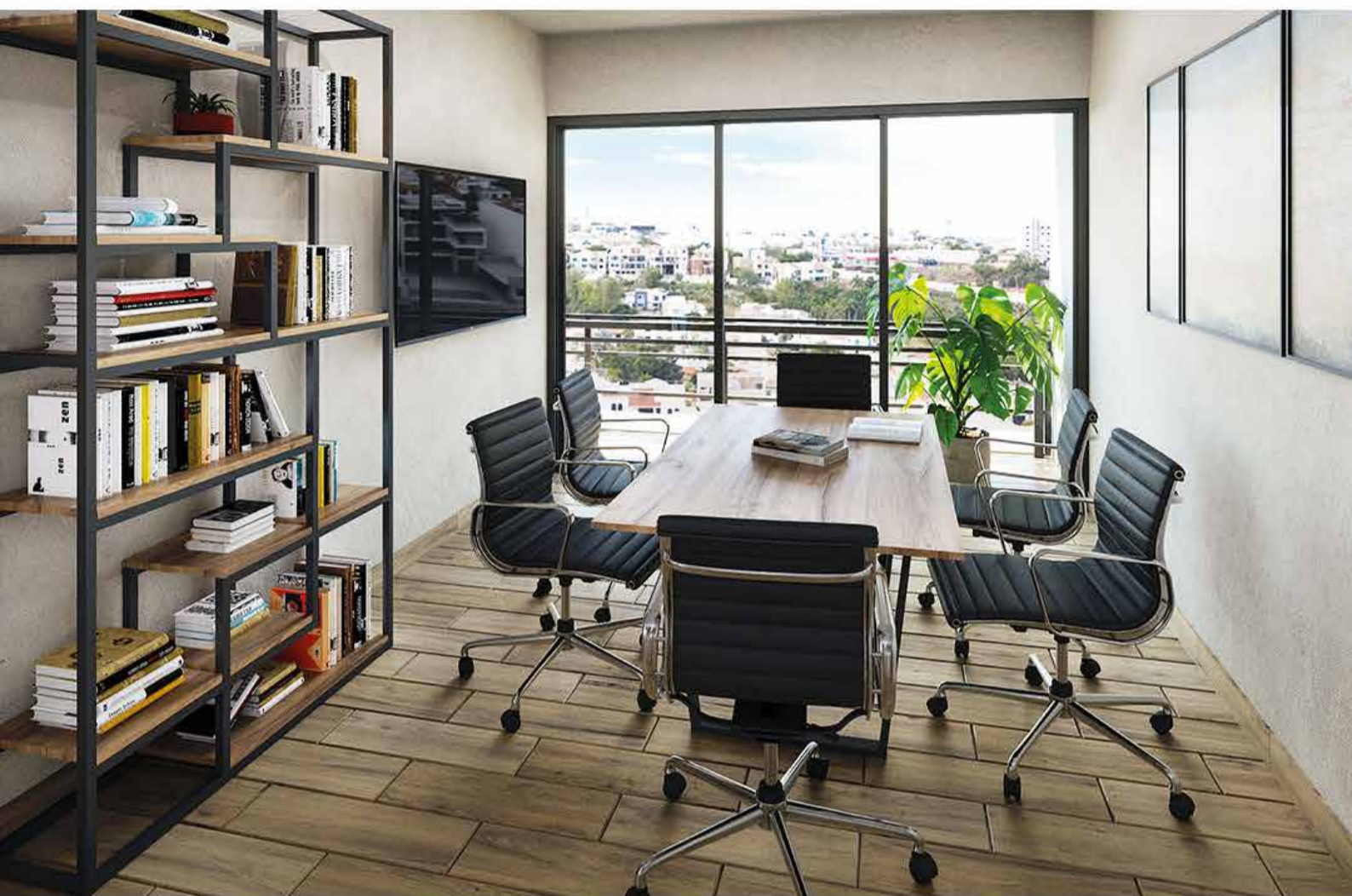
SALA DE JUNTAS