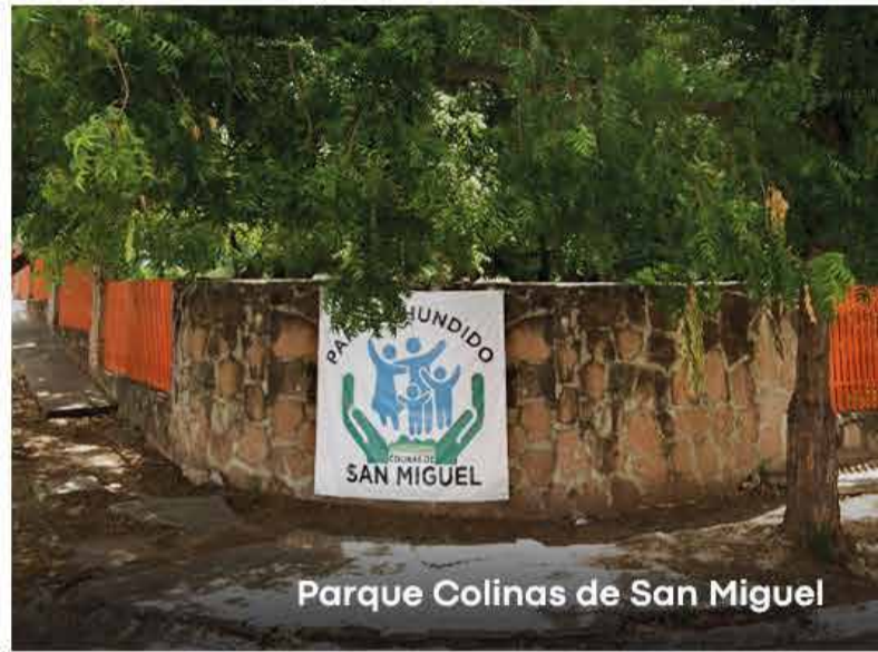
Parque Colinas de San Miguel