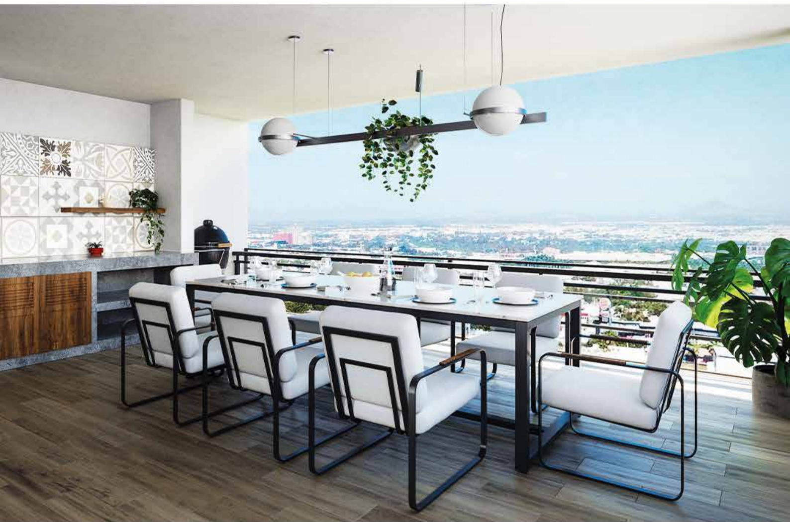
ROOF GARDEN - TERRAZA