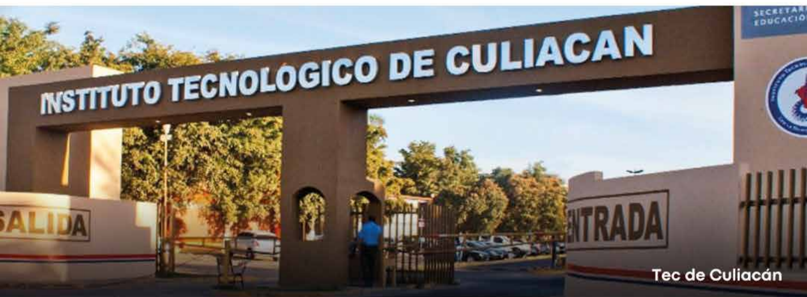
Tec de Culiacán