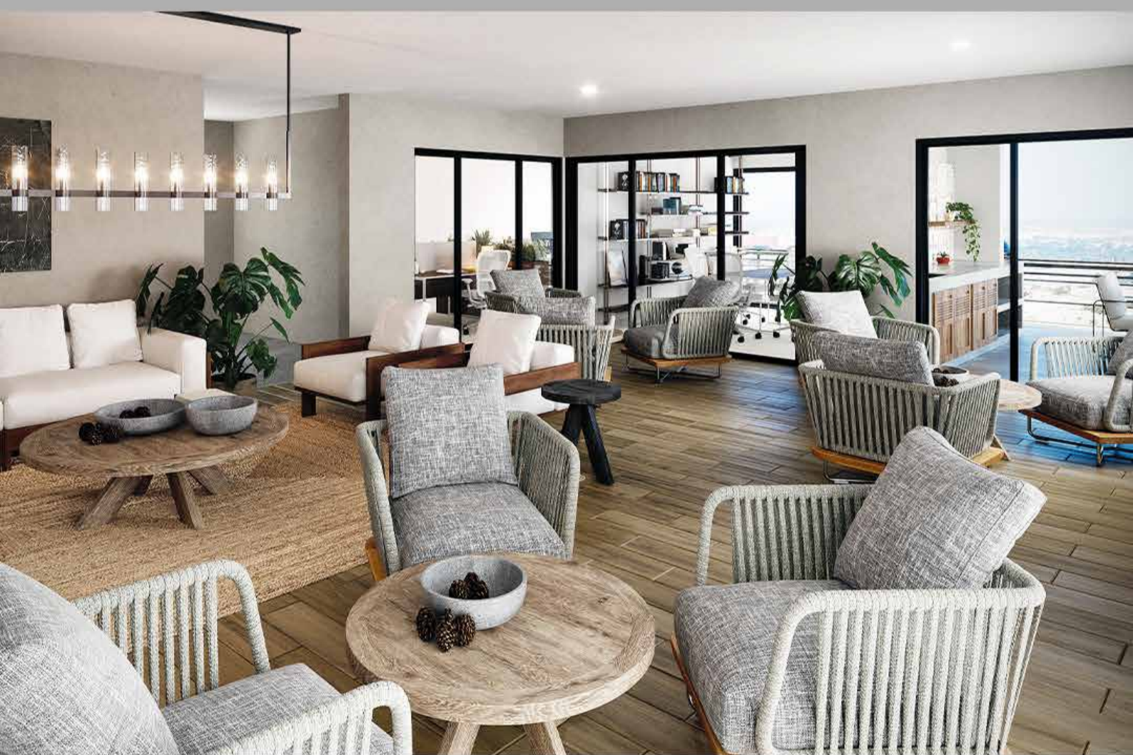
ROOF GARDEN - ÁREA COMÚN

*Imágenes con fines estrictamente ilustrativos para mostrar características generales del proyecto ofrecido y no constituyen una representación exacta de la realidad.